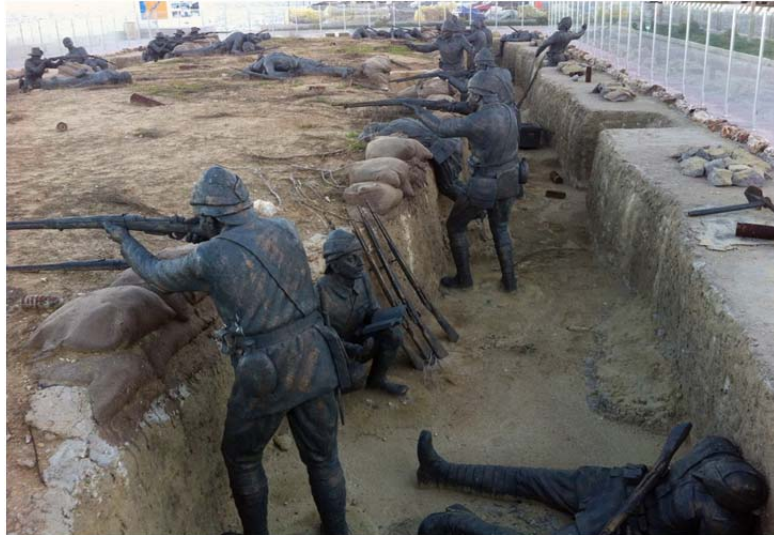
Konstnärlig gestaltning med skulpturer i skyttegrav. Gallipoli 1914