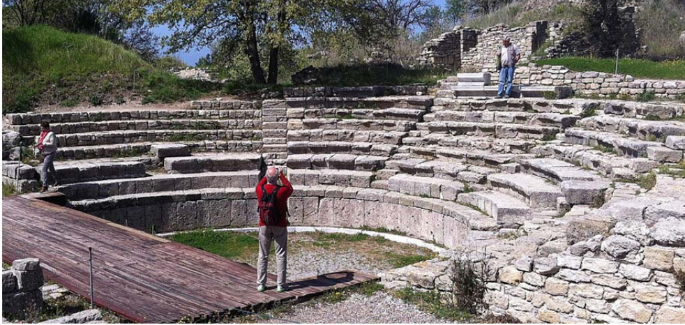
Teatern i Troja

Det är också möjligt att följa samme Vergilius som ledsagare i underjorden i Dantes Gudomliga komedi och beskåda det opublicerade - hur författaren vid tillkomsten av verket resonerar kring graden av synd där olika historiska personer placeras olika otrevligt i de inre kretsarna. Slutligen går det att ta del av all sorg och förtvivlan från vår egen tid och 1900-talets krig där soldaterna dödas med hjälp av modern krigsutrustning i ett tempo som måste givit färjkarlen Caron bekymmer. Vid stranden av floden Styx måtte köerna ringlat sig med alla som skulle över floden.