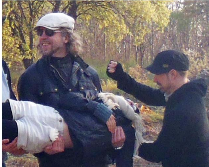
Offret av en student 2014

Temat med offret har kanske funnits i det kollektiva minnet, och kanske det betyder något som ibland används för ond bråd död eller för att knyta den döde till en berättelse som alla känner till och som har stort symbolvärde. Att den döde är en kvinna tror jag på eftersom gestalterna på sarkofagen är kvinnor, men att det är Priamos dotter som ett bevis för händelser i Illiaden kan jag inte köpa. Men denna metaberättelse är en bra berättelse i sig.