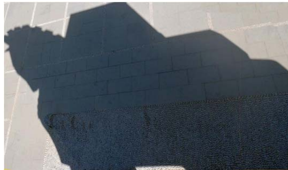
Skuggan av en trähäst i Troja 2014

Olle Halldin/Bibliotekarie vid SKH 2014-05-12