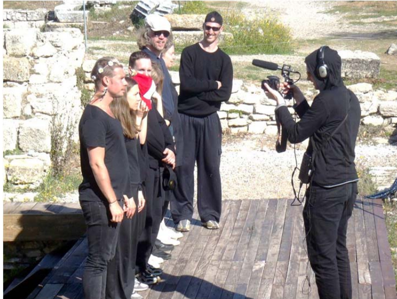
Kören i arbete

I Flandern gjordes den kroppsliga läsningen av krigets platser, soldaternas gravfält och de krigsmonument vilka som ett sorts gigantiskt dåligt samvete bevarar minnet av det som hänt. I Troja finns inga minnesplatser, monument eller gravar men det är likväl en krigsskådeplats. Och anledningen till båda krigen är politisk. I första världskriget är det ett politiskt spel mellan olika länder och deras syn på rätt och fel samt behov av utrymme. Kriget i Troja är politiskt på så sätt att som en följd av gudarnas intriger berövas grekerna sin Sköna Helena vilken trojanerna anser sig ha moraliskt rätt till och som de vägrar lämna tillbaka. Således förklarar grekerna krig. Att det sedan inte bara är en redovisning av krigets fasor utan också ett drama mellan människor gör det till en berättelse på samma sätt som skildringen av första världskriget i romanen På västfronten intet nytt . (av Erich Maria Remarque, 1929)