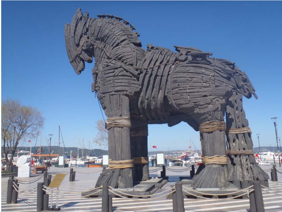
Den trähäst som användes i filmen Troja 2004.

Rekvisitan blev en gåva från Brad Pitt till den turkiska staden Canakkale.