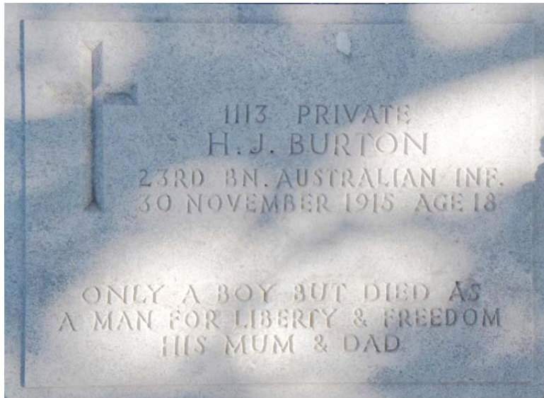
Australiensisk soldat 18 år, 1915