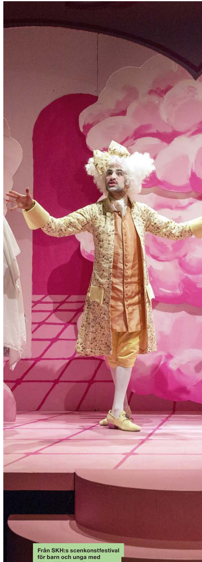
Från SKH:s scenkonstfestival för barn och unga med föreställningen Canis Lupus .