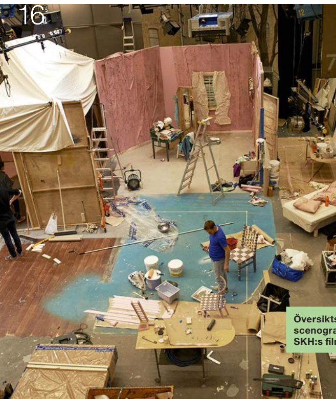
Översiktsbild från en scenografiövning i SKH:s filmstudio.