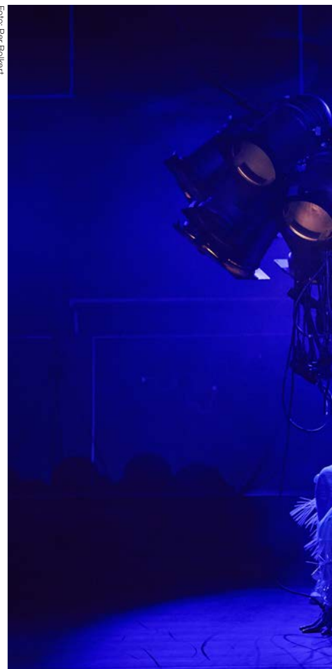
Från examensföreställningen Rawbotic .