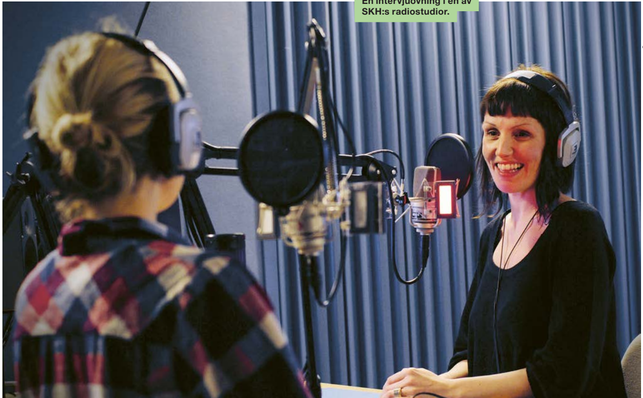
En intervjuövning i en av SKH:s radiostudior.

Animation Dokumentärt berättande Fiktionsregi Filmfoto Immersiv mediaproduktion Klippning Ljud Manus Produktion Produktionsdesign