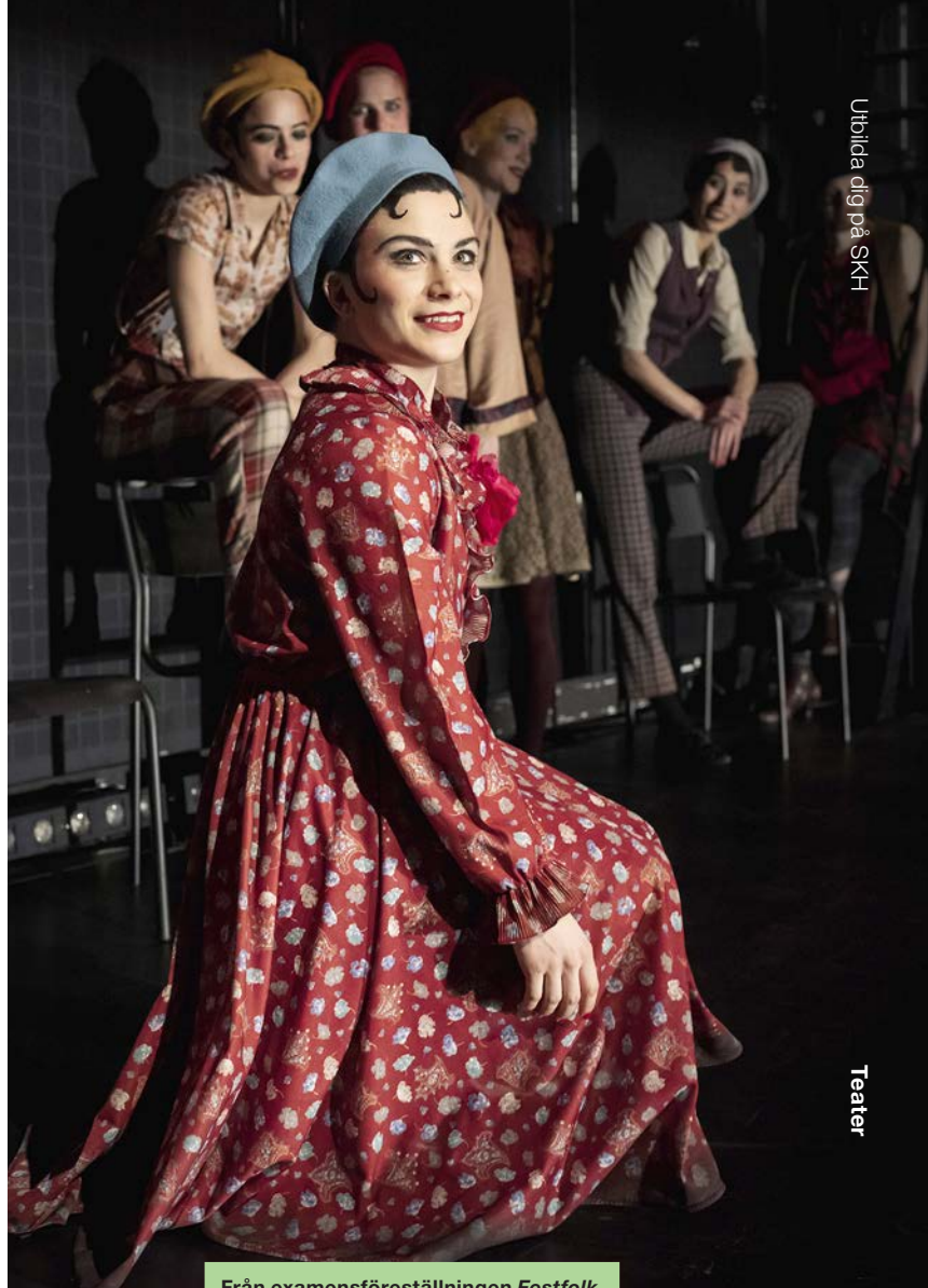
Från examensföreställningen Festfolk .