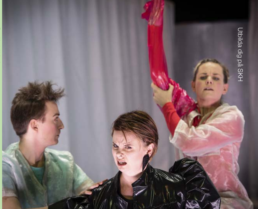
Utbilda dig på SKH